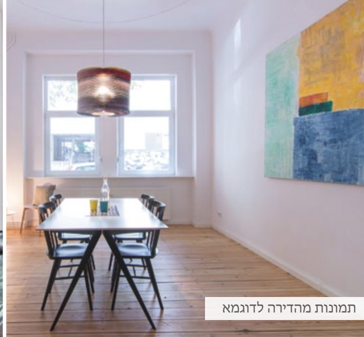
תמונות מהדירה לדוגמא