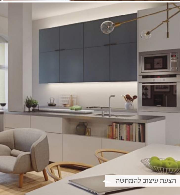
הצעת עיצוב להמחשה