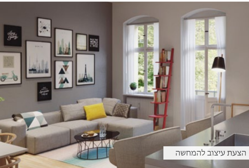
הצעת עיצוב להמחשה